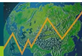
表 4：中國內地出口(按主要市場分類)