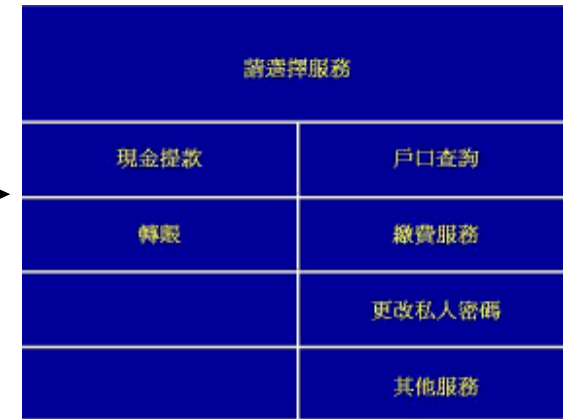
第三步 - 選擇“轉賬”