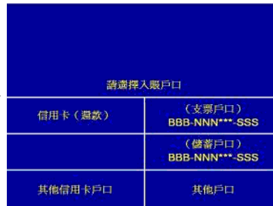
第五步 - 選擇戶口(轉賬至)