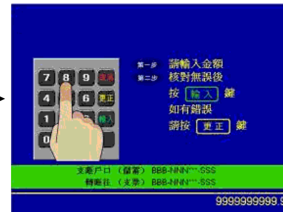
第六步 - 輸入金額