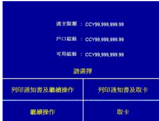
第五步 - 選擇“列印通知書及取卡”