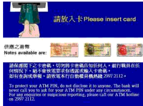
第一步 - 將卡放入