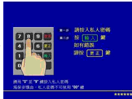
第二步 - 輸入密碼