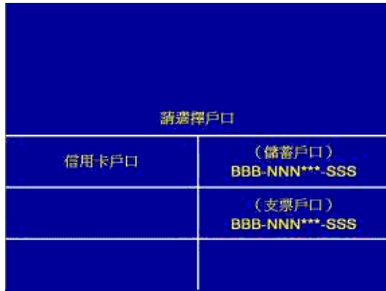
第四步 - 選擇戶口