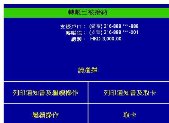
第七步 - 選擇“列印通知書及取卡”