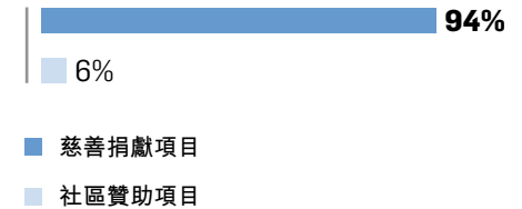
2020年社區投資開支分佈(以百分比為單位)：